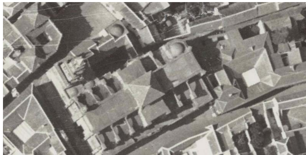
AÑO 1956. ESCALA 1:1000