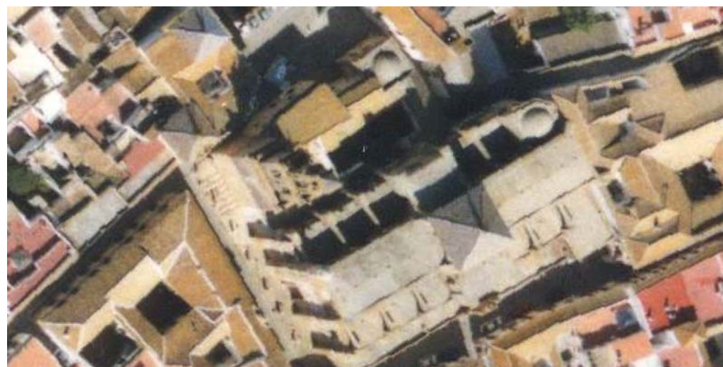
AÑO 2003. ESCALA 1:1000